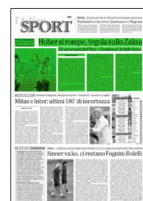
Superficie 22 %

ARTICOLO NON CEDIBILE AD ALTRI AD USO ESCLUSIVO DEL CLIENTE CHE LO RICEVE - 4